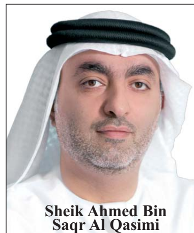
Sheik Ahmed Bin Saqr Al Qasimi

Prenant la parole le président de la CCFA a rappelé d'emblée que cette initiative de la CCFA pour se réunir autour des représentants de la zone économique de libre échange à Ras Al Khaïmah était la troisième ou la quatrième de son genre, soulignant au passage que presque tous ceux qui ont « répondu à cette nouvelle invitation ne sont pas seulement intéressés de mieux connaître cet émirat, mais que la majorité d'entre eux avait des activités ou des projets dans cette zone ». Il a indiqué que cette rencontre s'inscrit tout naturellement dans la vocation de la Chambre de commerce franco-arabe de promouvoir les relations économiques entre la France et les pays de la zone en développant notamment le tissu des entreprises adhérentes à la CCFA pour les accompagner dans leurs démarches dans cette région.